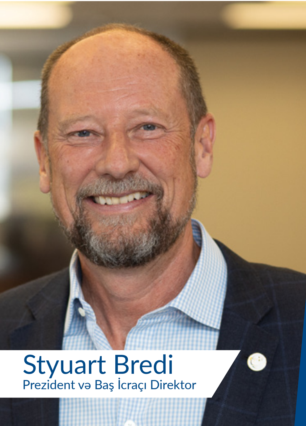
Styuart Bredi Prezident və Baş İcraçı Direktor